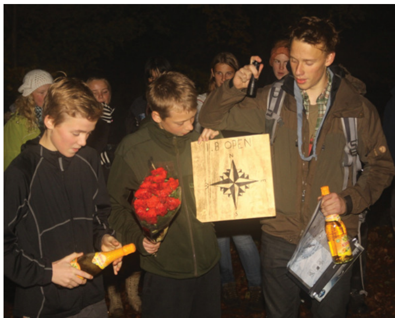
1. Birkerød Open, den vindende patrulje